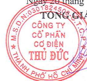
Võ Tiến Dũng