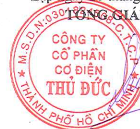
Võ Tiến Dũng